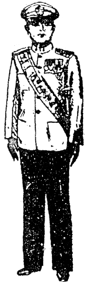
เครื่องแบบเต็มยศ