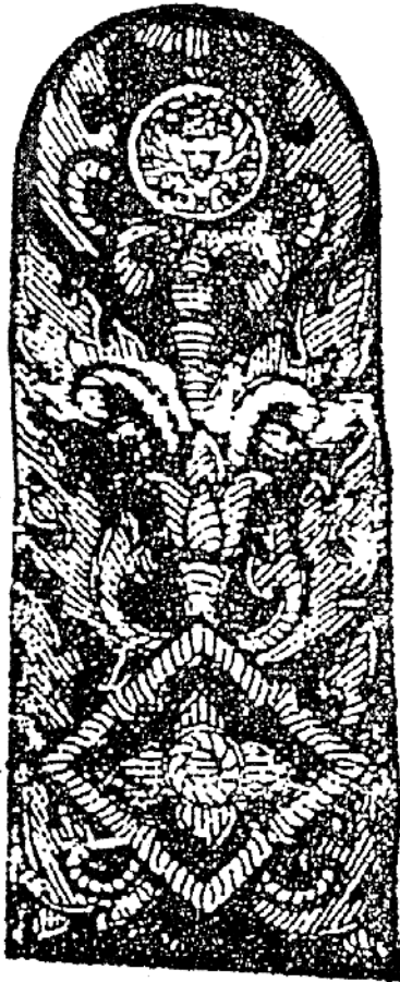
อินทราณเครื่องแบบปกติขาว