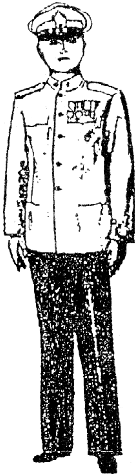
เครื่องแบบครึ่งยศ