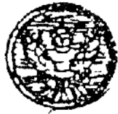
เครื่องหมายสังกัด และดุมโลหะสีทองตราครุฑฟ้าห์