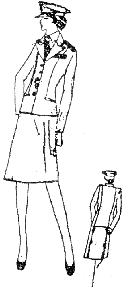
เครื่องแบบปกติหญิง