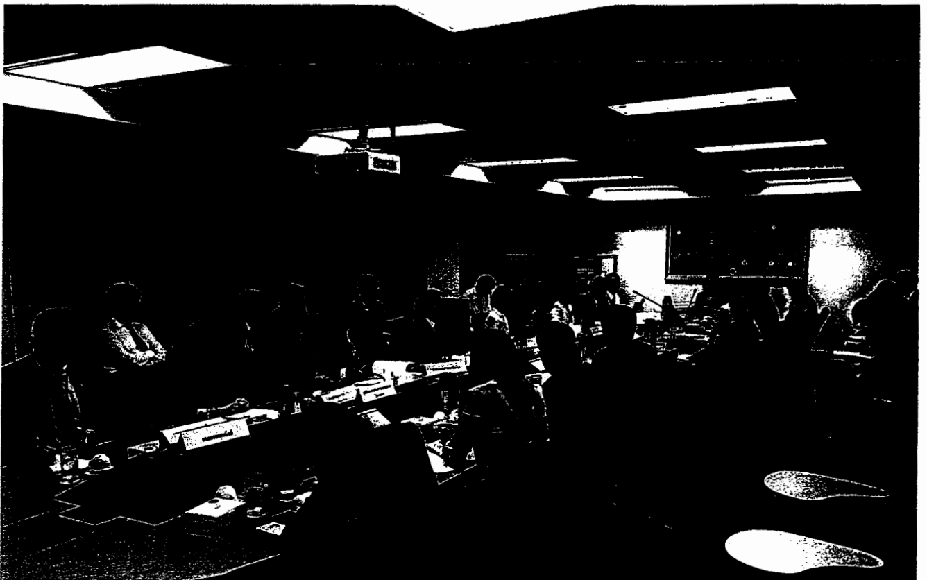
ภาพถ่ายการประชุมเพื่อรับฟังความคิดเห็นของผู้ที่เกี่ยวข้องต่อร่างพระราชบัญญัติคุ้มครองการดำเนินงาน ขององค์การระหว่างประเทศและการประชุมระหว่างประเทศในประเทศไทย พ.ศ. ....