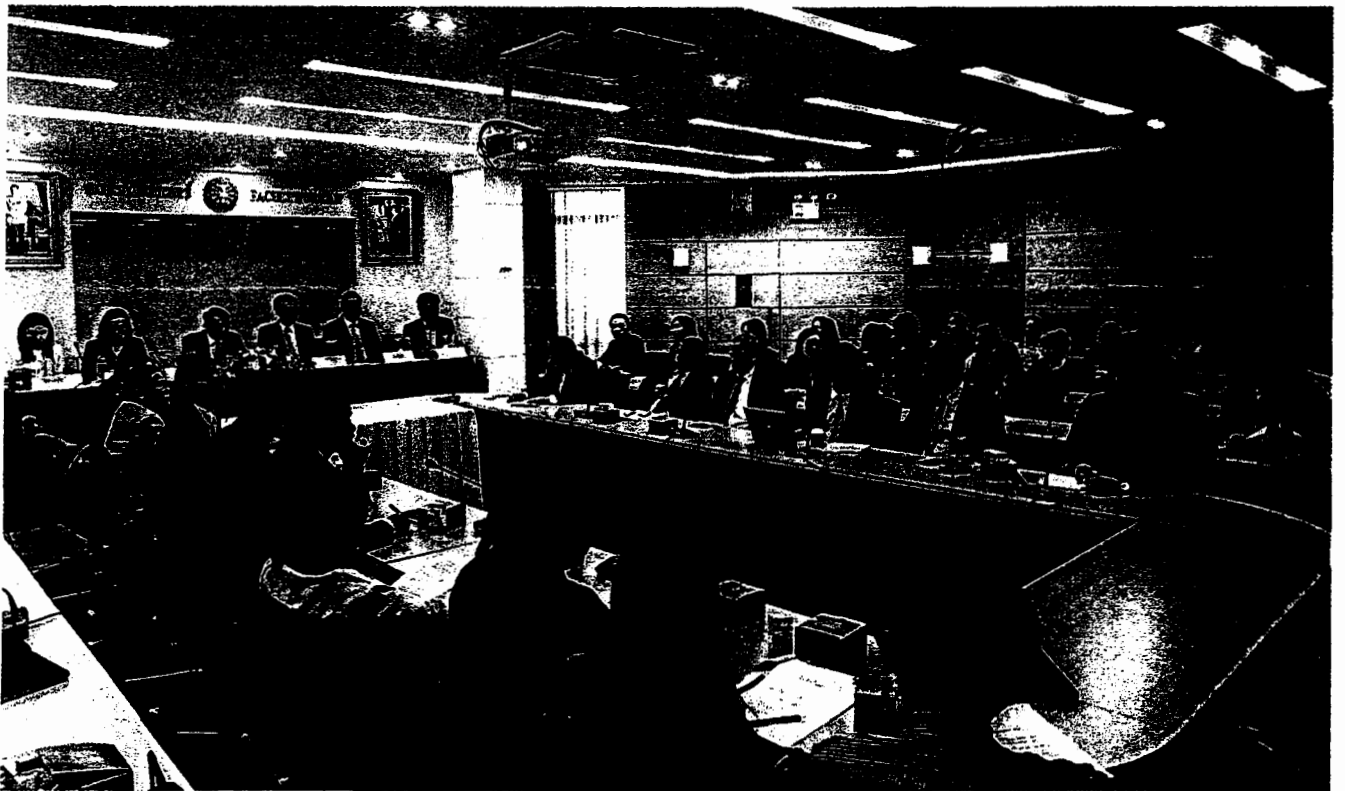
ภาพถ่ายงานสัมมนาทางวิชาการเรื่อง “ร่างพระราชบัญญัติเอกสิทธิ์และความคุ้มกันสำหรับ องค์การระหว่างประเทศและการประชุมระหว่างประเทศในประเทศไทย พ.ศ. .... ประเทศไทยกับก้าวสำคัญสู่การเป็นศูนย์กลางขององค์การระหว่างประเทศและการประชุมระหว่างประเทศ” วันพฤหัสบดีที่ ๒๑ ธันวาคม ๒๕๖๐ เวลา ๑๓.๓๐ - ๑๖.๓๐ น. ณ ห้องประชุมจิตติ ดิงศภัทย์ คณะนิติศาสตร์ มหาวิทยาลัยธรรมศาสตร์ (ท่าพระจันทร์)