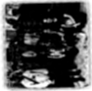
21 กันยายน 2561 วิทยาลัยชุมชนสงขลา หน่วยงานชุมชนที่รักแห่ง จังหวัดตรัง ศึกษาการลูกกาเฟนในสวนยาง วันที่ 18 กันยายน 2561 ณ ไร่ยางทอง และ สวนวังทองท่า อำเภอสีลา จังหวัดตรัง