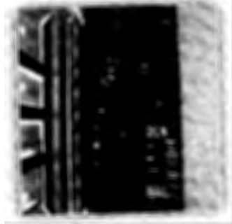
27 กันยายน 2561 วิทยาลัยชุมชนสุดา จัดพิธีรับเสด็จ อเนกโรจน์บุตรเทพีสำเร็จการศึกษาประจำ ปีการศึกษา 2560 วันที่ 22 กันยายน 2561 ณ อาคารศูนย์วิทยบริการ วิทยาลัยชุมชน สุดา อำเภอเมืองสุดา จังหวัดสุโขทัย