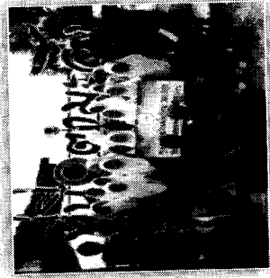
20 กันยายน 2561 วิทยาลัยชุมชนสุดา แดงโปงเท่ปุระสมัย พากรรณำพิทักษ์สถาบันเสียดาย 11 หลัง วันที่ 17 กันยายน 2561 ที่เกาะด่านะลิ้ง อำเภอเมือง จังหวัดสุโขทัย

ศึกษา 2560 22 กันยายน 2561 ณ วิทยาลัยชุมชนสุดา